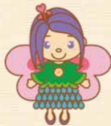
山都町協会のキャラクター しゃくりん