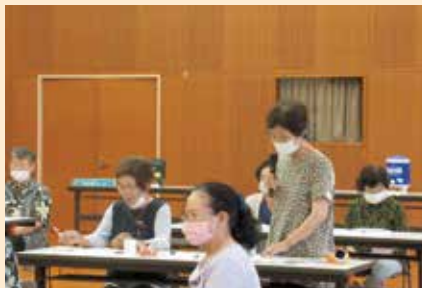
各地区サロン紹介

今後も各地区のサロン活動等に訪問させていただきます。どうぞよろしくお願いいたします。