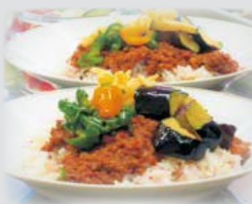
完成! 鹿肉キーマカレー