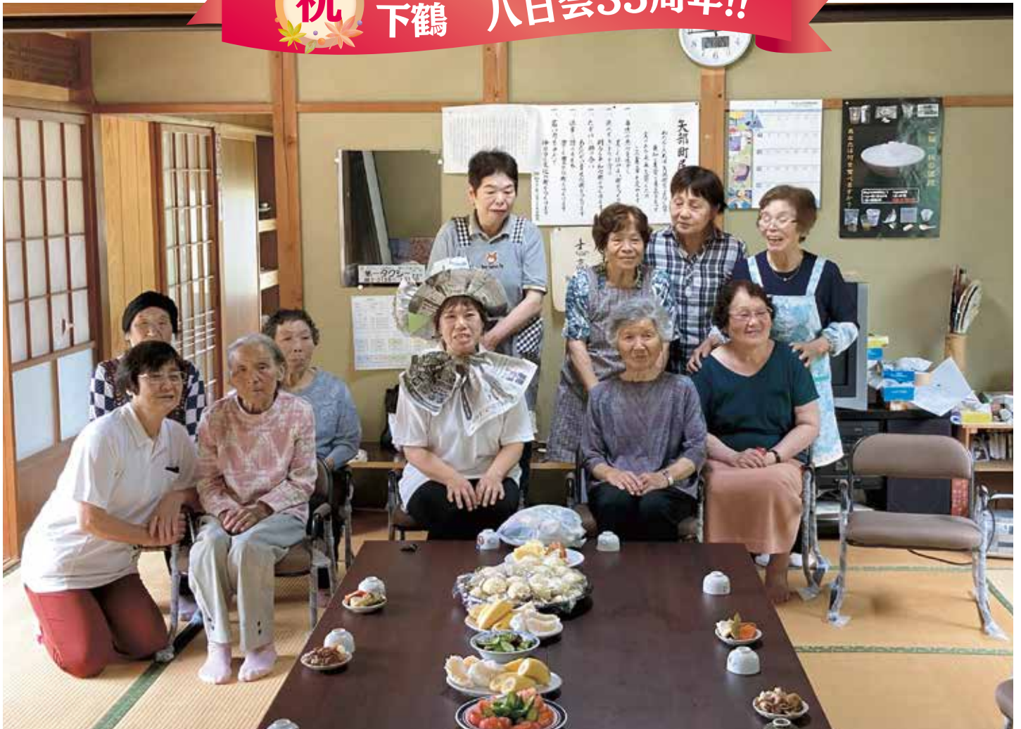
素敵なお顔をハイ、チーズ!!