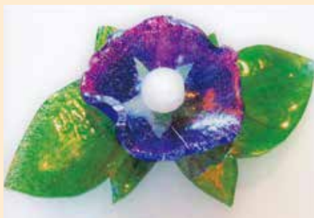
プラバンで作った朝顔のブローチ